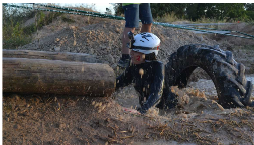
3a edició de La Marranada (maig 2018)

Durant el mes de maig se celebraran els actes de les Festes de Sant Isidre, patró de la pagesia. La Comissió de Festes, les entitats del poble i l'Ajuntament de Font-rubí estan organitzant diversos actes, compresos entre el 17 i el 25 de maig . Ben aviat us enviarem el programa d'actes. Esperem la vostra participació!