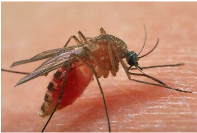
Femella de mosquit comú ( Culex pipiens ) prenent sang sobre humà.

Aquest estudi és finançat pel Servei de Salut Pública de la Diputació de Barcelona.