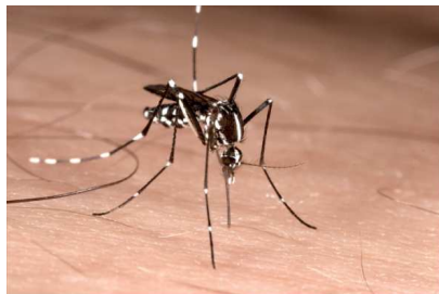
Femella de mosquit tigre ( Aedes albopictus ).